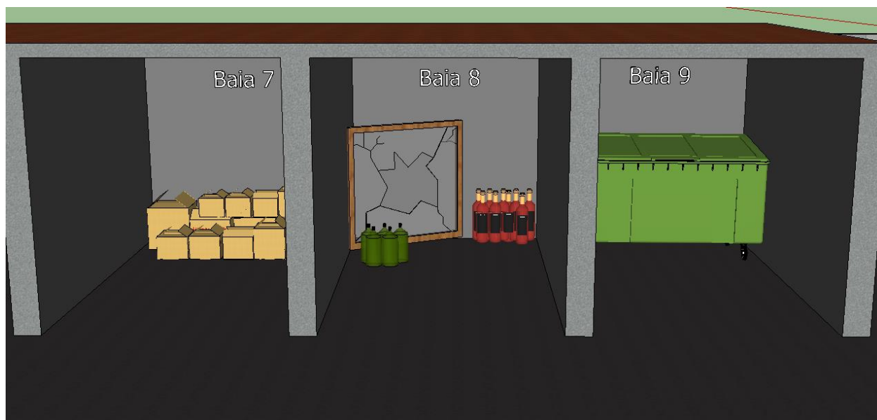
Figura 6: Proposta do eco-ponto para o Município de Maringá/PR – baias 7, 8 e 9. Fonte: Autores, 2017.

Na sétima baia poderão ser descartados papéis e papelões. Estes resíduos poderão ser destinados a órgãos de reciclagem, onde poderão ser reutilizados. A classificação deste resíduo é de Classe II A, não inerte, definida pela NBR 10.004, da ABNT. Na oitava baia se encontram resíduos não degradáveis (ND), mas que podem ser 100% recicláveis. Poderão ser depositados neste local garrafas de vidro, potes, espelhos, frascos limpos de produtos de limpeza e alimentícios, cacos de qualquer produto citado acima, entre outros. E, por último, a nona baia será construída em local fechado, pois para ali serão destinados os resíduos de classificação perigosa, como pilhas e lâmpadas fluorescentes (Figura 6).