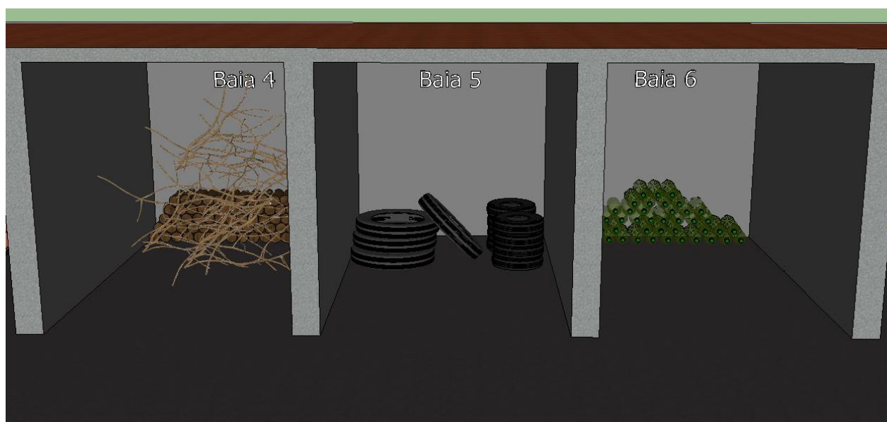
Figura 5: Proposta do eco ponto para o Município de Maringá/PR – baias 4, 5 e 6.

Para a quarta baia, poderão ser destinadas as podas de árvores e madeiras, provenientes da construção civil, e madeiras naturais, de modo geral. Na NBR 10.004/2004 este resíduo é classificado como resíduo de classe II, pois é aquele considerado não perigoso, que não causa riscos nem impactos. A quinta baia é o local destinado aos pneus de carros, motos e caminhões. São classificados como Classe II A os não inertes, por apresentarem teores de metais nos extratos superiores aos normais, instituídos pela NBR 10.004/2004. E a sexta baia será destinada a resíduos plásticos, como embalagens descartáveis (sacolas, copos, potes, garrafas, utensílios de limpeza e brinquedos), materiais sintéticos e derivados do petróleo (Figura 5).