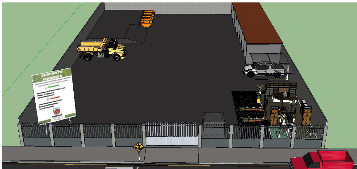
Figura 1: Proposta do ecoponto para o Município de Maringá/PR – projeção ampliada.

Segundo Pinto (2005), nos pontos de entrega devem apresentar as seguintes características: demarcação da área, para a qualidade ambiental; aproveitamento de desníveis ou criação de uma superfície elevada para que os resíduos pesados sejam descartados diretamente nas caçambas; obtenção de espaço suficiente para manobras de veículos leves e veículos pesados de cargas e descargas; identificação por meio de placas de sinalização, fazendo com que a população descarte, corretamente, cada resíduo em seu lugar correspondente.