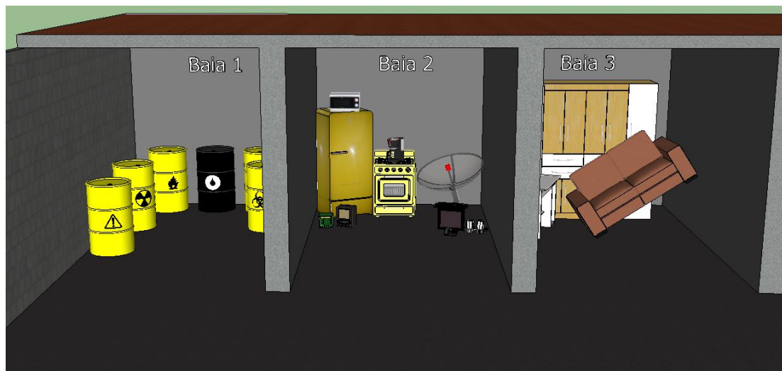
Figura 4: Proposta do eco ponto para o Município de Maringá/PR – baias 1, 2 e 3.

Para a quarta baia, poderão ser destinadas as podas de árvores e madeiras, provenientes da construção civil, e madeiras naturais, de modo geral. Na NBR 10.004/2004 este resíduo é classificado como resíduo de classe II, pois é aquele considerado não perigoso, que não causa riscos nem impactos. A quinta baia é o local destinado aos pneus de carros, motos e caminhões. São classificados como Classe II A os não inertes, por apresentarem teores de metais nos extratos superiores aos normais, instituídos pela NBR 10.004/2004. E a sexta baia será destinada a resíduos plásticos, como embalagens descartáveis (sacolas, copos, potes, garrafas, utensílios de limpeza e brinquedos), materiais sintéticos e derivados do petróleo (Figura 5).