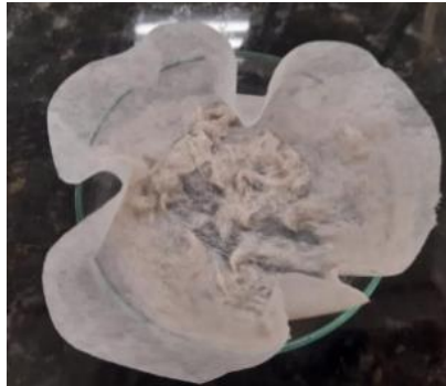
Figura 4. Pelo hidrolisado com 30 gr/L de extrato de mamão, 9,5 g/L de sulfito de sódio e 94 g/L de ureia, após 24 horas.