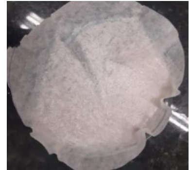
Figura 5. Pelo hidrolisado com 5 gr/L de papaína comercial, 7,5 g/L de sulfito de sódio e 70 g/L de ureia, respectivamente, após 24 horas.