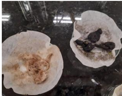
Figura 3: Pelos não hidrolisados com extrato de mamão

mostrou que tanto com os maiores níveis de reagentes, quanto os menores, resultou em hidrólise. Assim, inferimos que, apesar de ter um custo econômico maior, o uso da papaína comercial diminui a necessidade de outros, constituindo-se também em uma técnica viável.