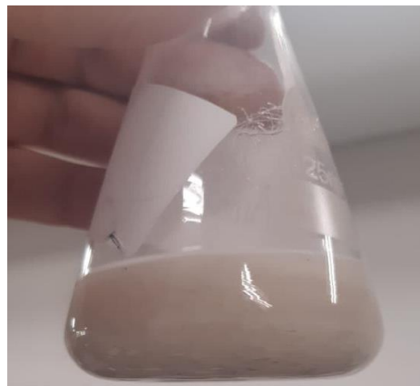
Figura 2. Pelos hidrolisados antes de serem filtrados e secos na estufa